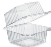
Plastbakkar með loki